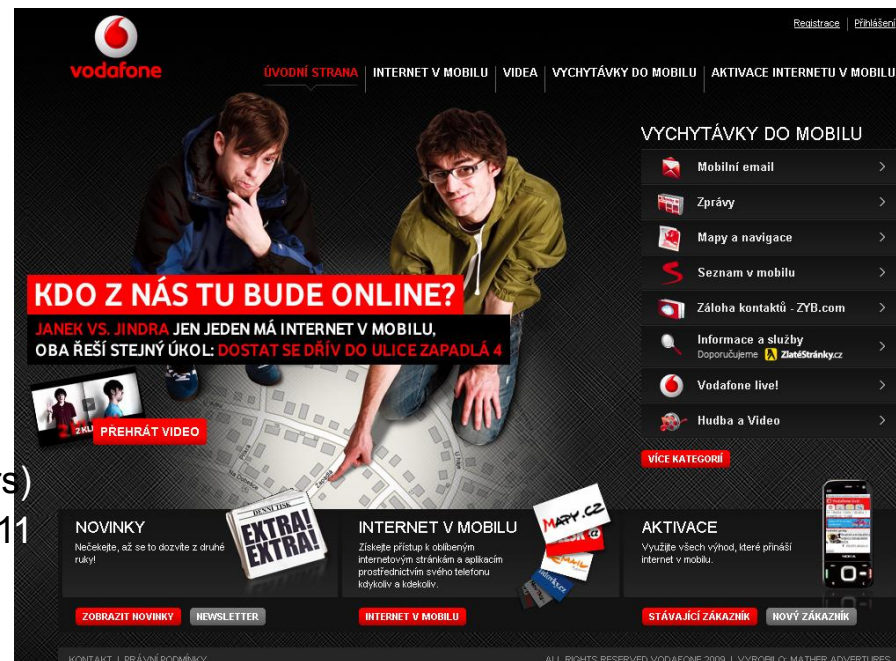
Vychytávky do mobilu (11 kategorií)